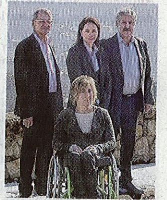
■ Les quatre candidats veulent aider les activités économiques « génératrices d'emplois ».

Les candidats poursuivent : « Notre choix est aussi celui du service à la population, notamment aux personnes âgées, mais aussi à la jeunesse, aux personnes en recherche d'emploi, souvent en grande souffrance en cette période de